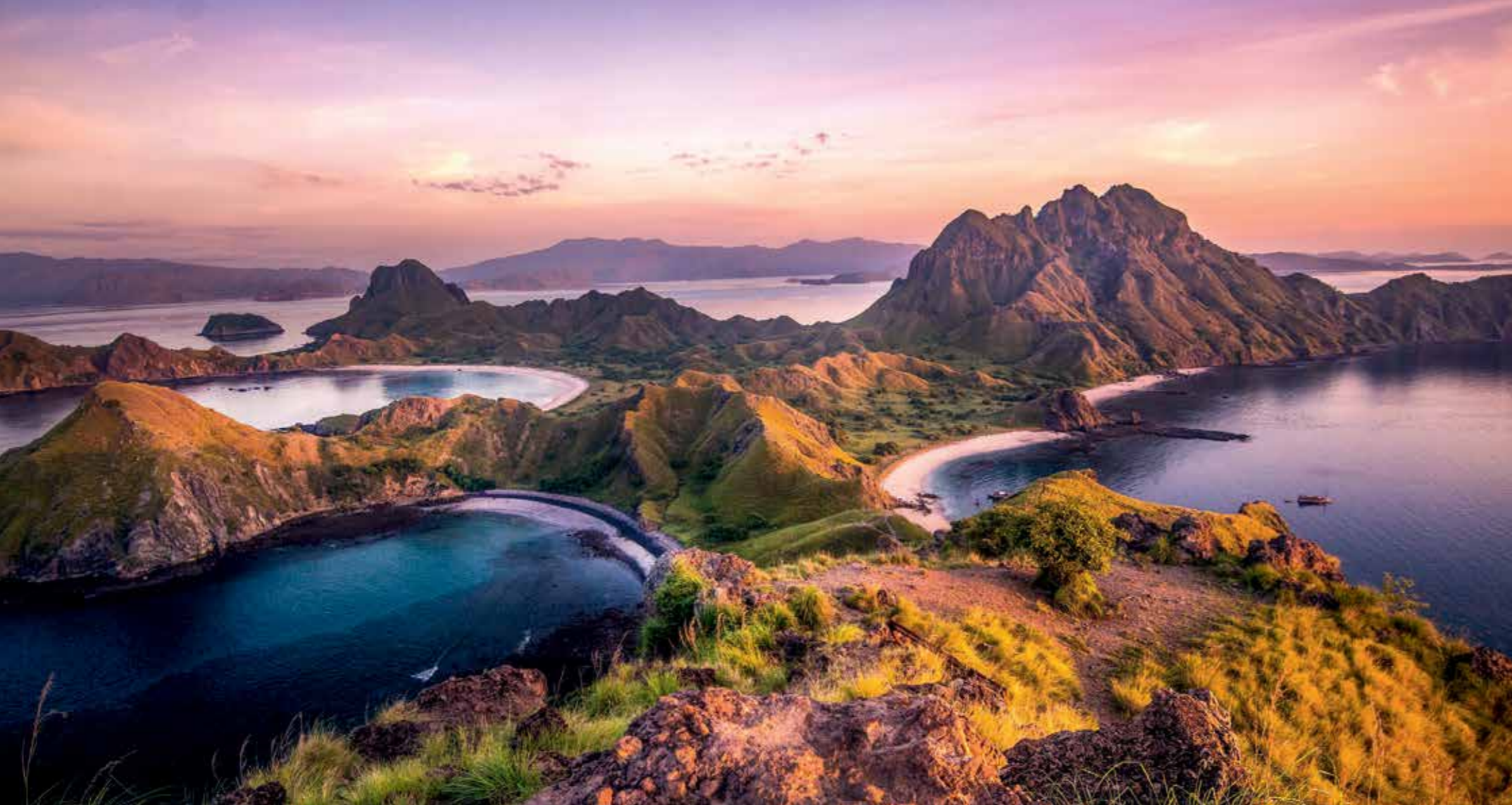
Die schönste Aussicht im Komodo-Nationalpark. Eine kurze Wanderung auf der Insel Padar führt zu einem Aussichtspunkt, der ein atemberaubendes Panorama mit Blick auf die umliegenden Inseln und das Meer eröffnet.