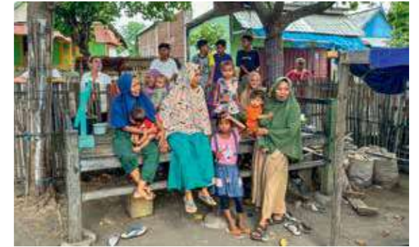
Begegnung mit den Bewohnern im Dorf Wera auf der Insel Bata.