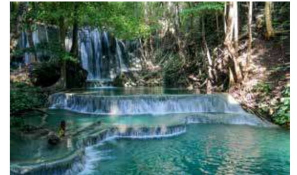
Erfrischendes Bad mit Wasserfall, Insel Labuan.