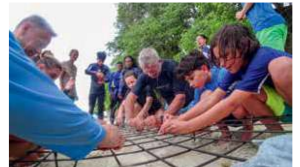
Gäste im Einsatz: Zusammen mit den Mitarbeitern der NGO „Coral Garden“ werden Korallen auf Hatamin Island gepflanzt.