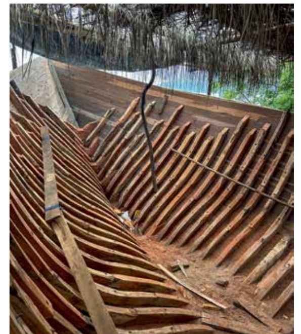
Ein Pinisi-Schiff im Rohbau.